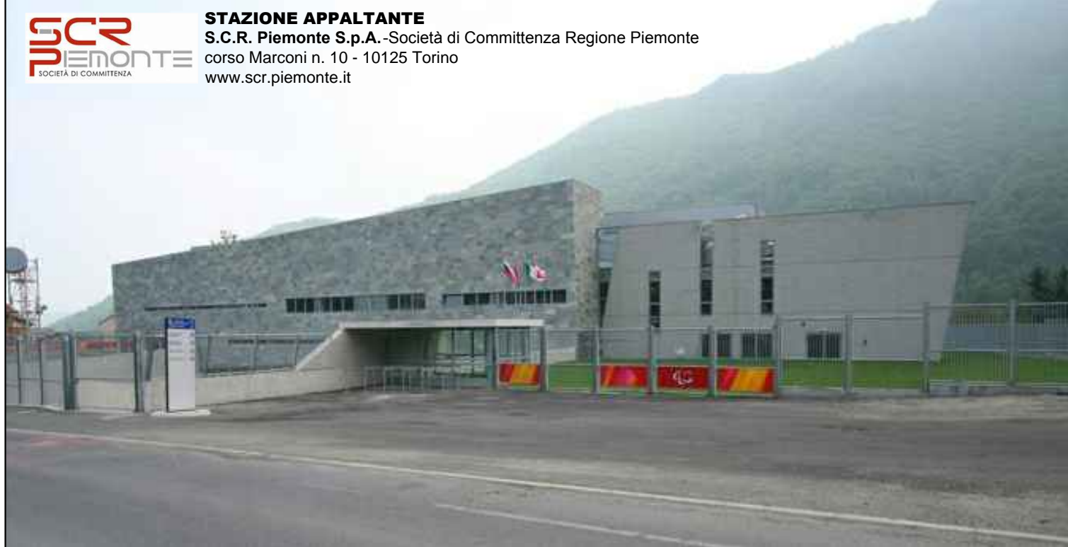
OGGETTO - REALIZZAZIONE DEGLI INTERVENTI DI MANUTENZIONE STRAORDINARIA E RIQUALIFICAZIONE PREVISTI ALL'INTERNO DEL PALAZZO DEL GHIACCIO DI TORRE PELLICE

mythos Studio di Architettura e Urbanistica